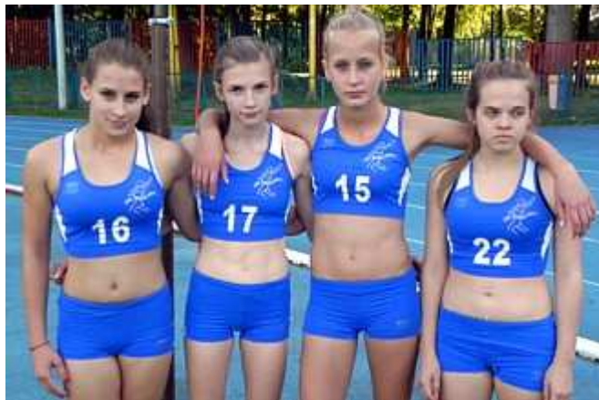
Po zakończonym biegu na 200 metrów