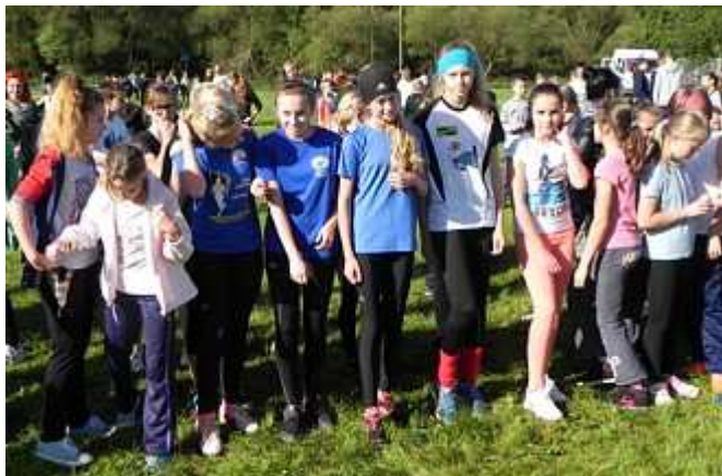
Startuje rocznik 2002/2003...