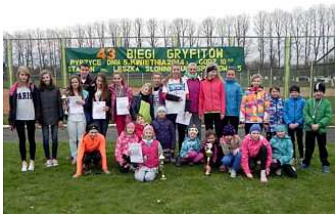
Grupa zawodników naszego klubu