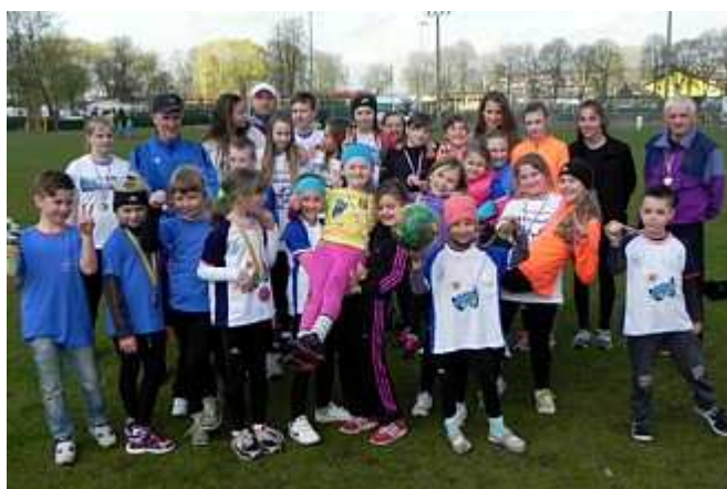
Grupa zawodników naszego klubu