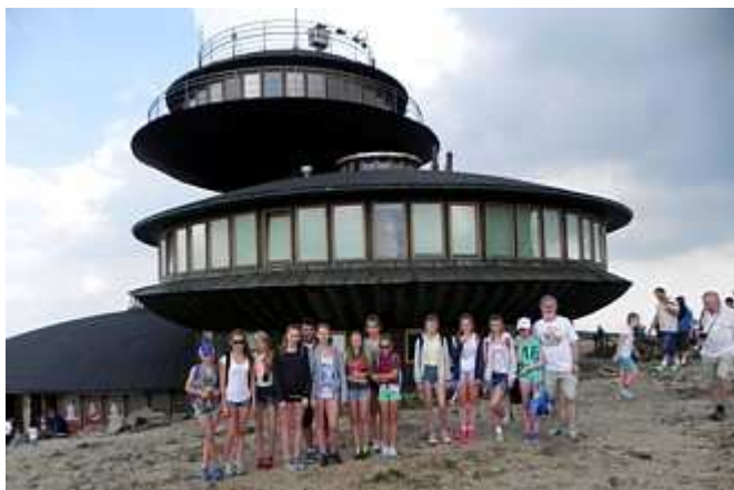
Na szczycie Śnieżki