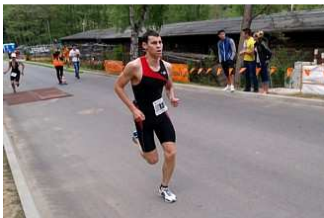
...i podczas biegu