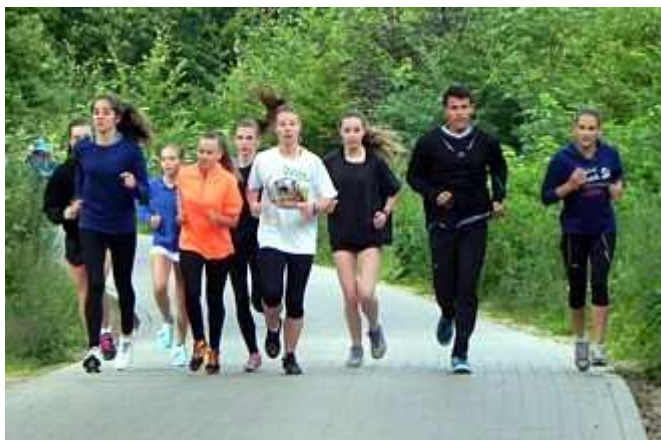
Tak się trening zaczyna...

Pierwszy dzień pobytu upłynął na spacerze po Karpaczu połączonym z obserwacją zawodów Śnieżka Run 2014 (14,3 km) na szczyt Śnieżki. Po południu odbyliśmy 1,5 godzinny trening. W niedzielę przed południem udaliśmy się na sudeckie szlaki. Z poziomu 700 m n.p.m. dotarliśmy do dwóch schronisk górskich: Samotnia (1195 m n.p.m.) oraz Strzecha Akademicka (1258 m n.p.m.). Po 3,5 godzinach powróciliśmy do miejsca naszego zakwaterowania. A po południu udaliśmy się na kolejny 1,5 godzinny trening pełen podbiegów pod górkę.