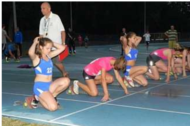
Fryzura na starcie najważniejsza