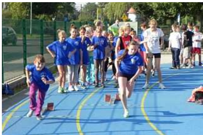
Start serii biegu na 60 metrów