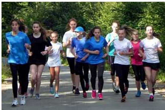
...i tak się kończy