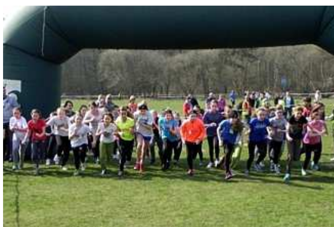
Start do biegu gimnazjalistek