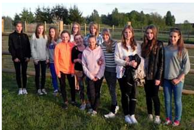
Policzanki startujące w Białogardzie