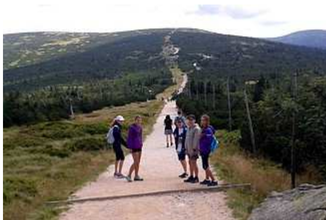
...i na szlaku