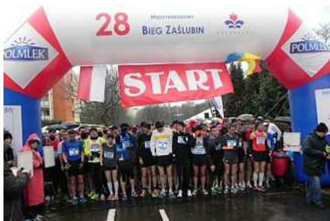
Start do biegu