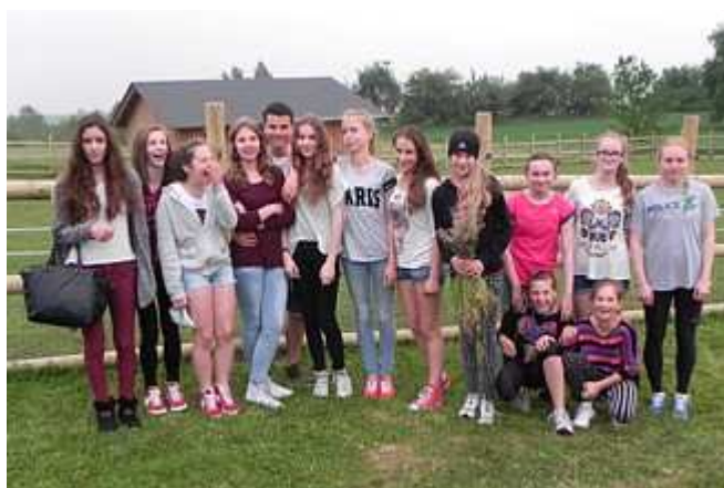
Ekipa naszego klubu