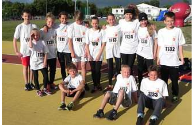
...oraz SP 8 Police