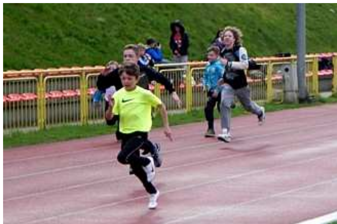
Bieg na 60 m chłopców