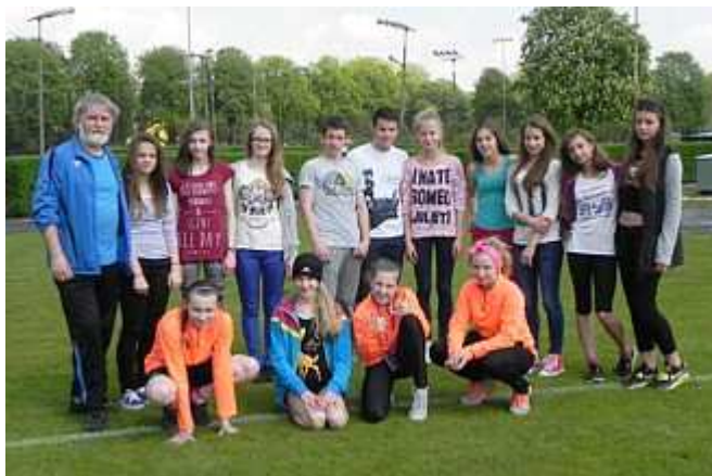
Reprezentanci naszego klubu