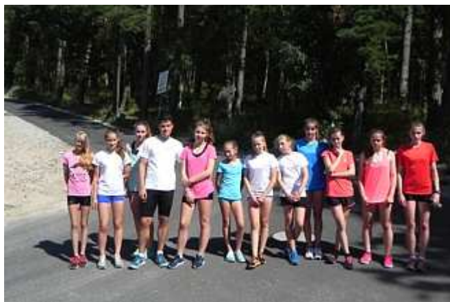
To tu straciliśmy najwięcej sił

Podsumowując zgrupowanie trzeba zaznaczyć ciężką pracę, którą wykonali jego uczestnicy. Treningi wyjątkowo nie należały do lekkich. Sporo wycieczek w góry też do lekkich nie należały. Ale cało i zdrowo wszyscy wracają do swoich domów. Zobaczmy jakie efekty tej pracy zawodnicy osiągną podczas startów w drugiej części sezonu, w tym zwłaszcza w Mistrzostwach Młodzików.