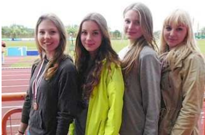
Sztafeta 4x100 metrów