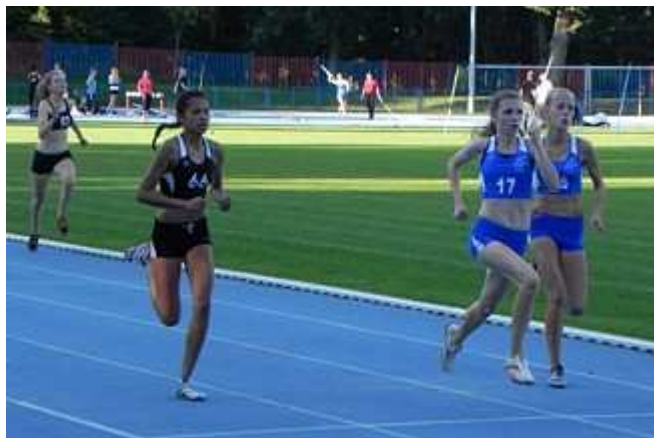
Walka o zwycięstwo w biegu na 300 metrów