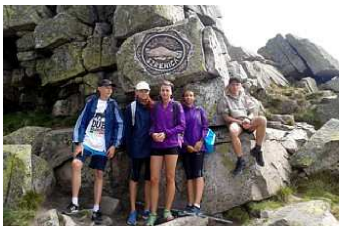
Jesteśmy na Szrenicy...