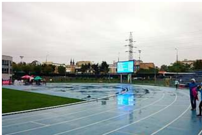
Taka pogoda panowała na stadionie