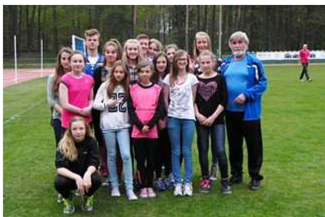
Nasi zawodnicy w Złocieniu