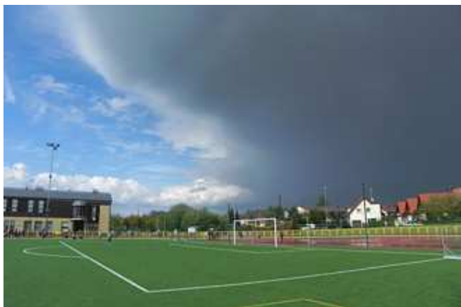
Chmury nad polickim stadionem

W dniu 7 maja 2015 roku na stadionie lekkoatletycznym w Policach odbył się VIII "Czwartek Lekkoatletyczny z PKN Orlen". W zawodach udział wzięło 93 zawodników. Zawody odbyły się przy dość ciepłej pogodzie z 15 minutową przerwą na ulewę. Najlepsze wyniki według "czwartkowych" tabel wielobojowych uzyskali w konkurencjach biegowych: Julia Komocka (2002) z ZS Nowe Warpno w biegu na 60 metrów wynikiem 8,63 oraz Przemysław Tulik (2002) z SP Tanowo w biegu na 60 metrów wynikiem 9,30. W konkurencjach technicznych najlepsze wyniki uzyskali: Melisa Kajzerek (2004) z SP Pilchowo w skoku wzwyż wynikiem 1,17 m. oraz Jakub Banaś (2002) z SP 8 Police w rzucie piłką palantową wynikiem 59,00 m.