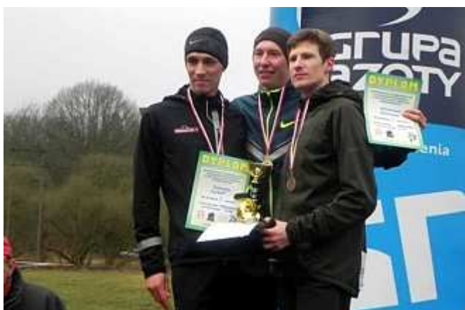
Trójka najlepszych w biegu mężczyzn...