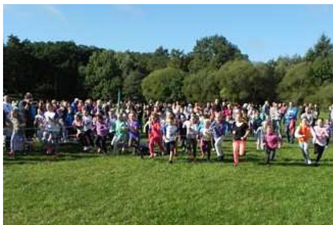
... oraz 2003/2004