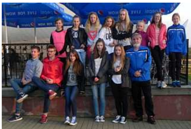
Ekipa klubu w Białogardzie