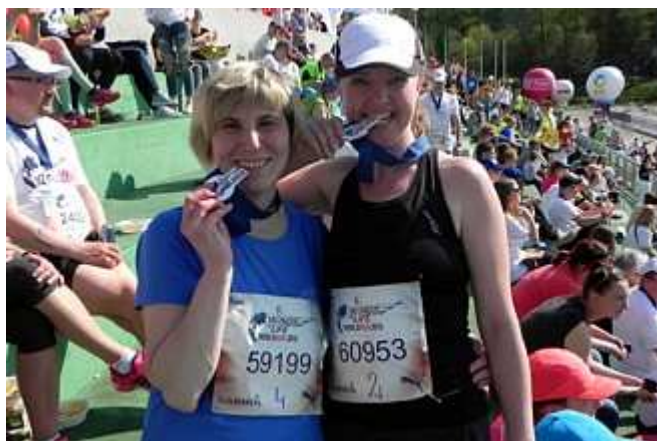
... oraz po biegu