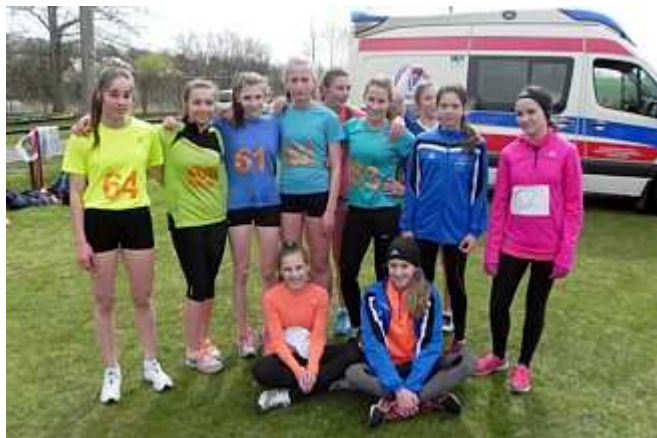
Część ekipy polickiej