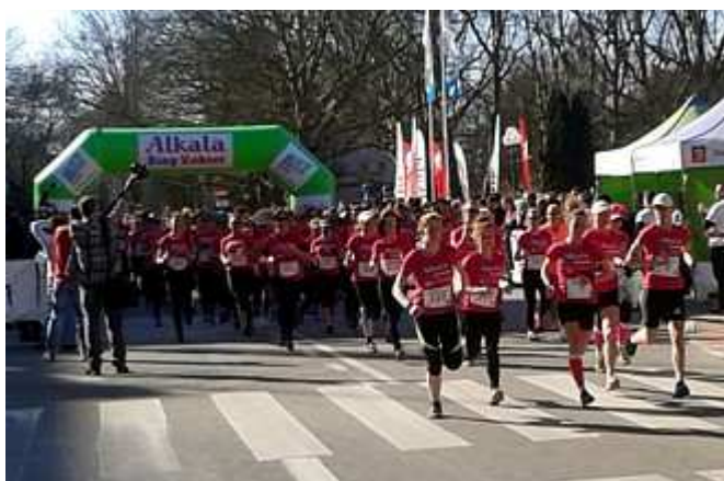
Start do biegu na 10 km...