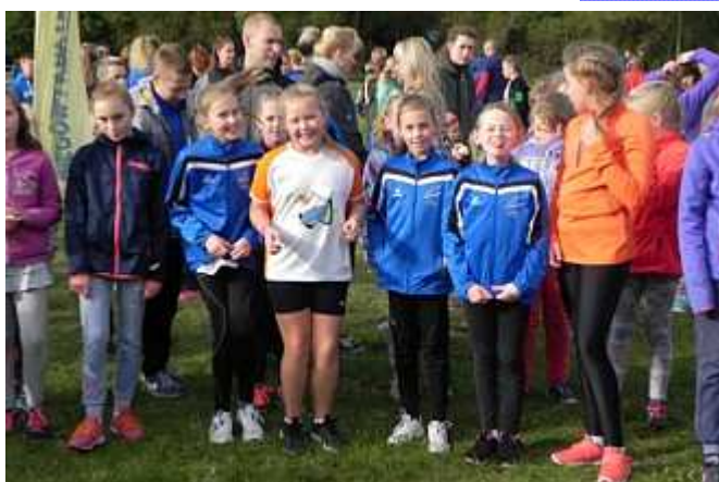
Na starcie zawodniczki rocznika 2005/2006