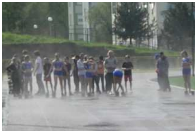
Po krótkiej ulewie wznowiamy zawody