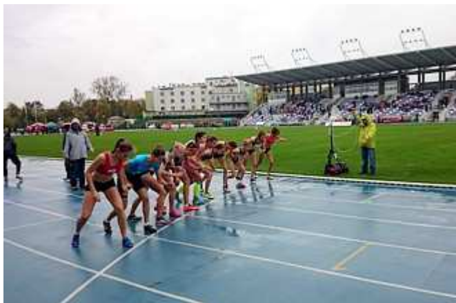
Start do biegu na 600 metrów