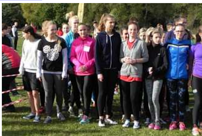
... oraz gimnazjalistki