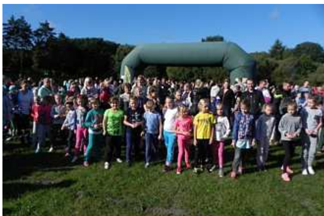
Na starcie zawodniczek rocznika 2007/2008