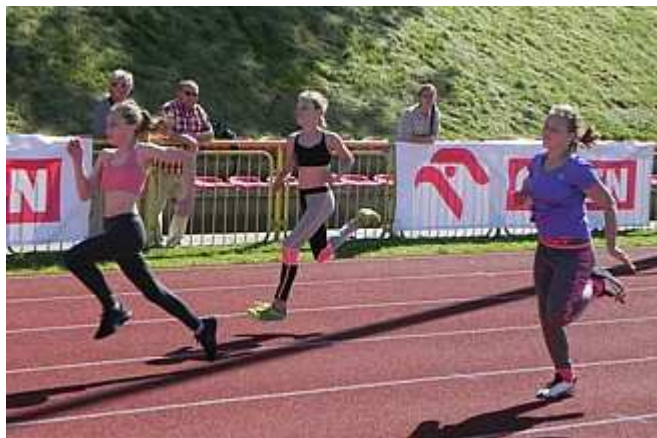
60 metrów dziewcząt