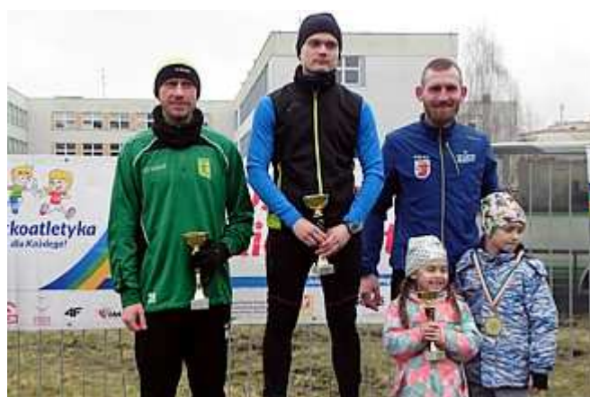
Najlepsi zawodnicy w kategorii Mężczyzn