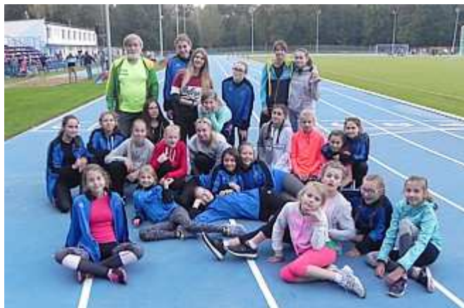
Ekipa naszego klubu