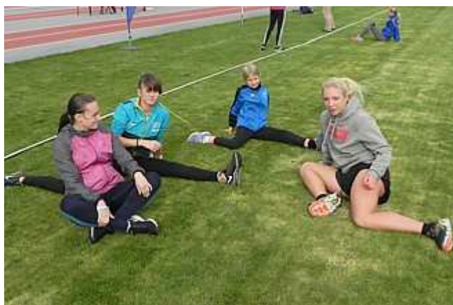
Policzanki na stadionie AWF Warszawa