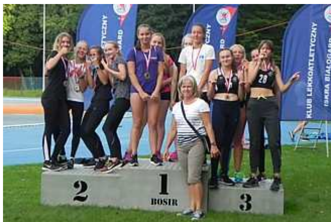
Brązowy medal sztafety 4x100 m