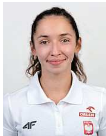
Sofia Ennaoui MKL Szczecin 1500 metrów 4:05.59 brązowy medal