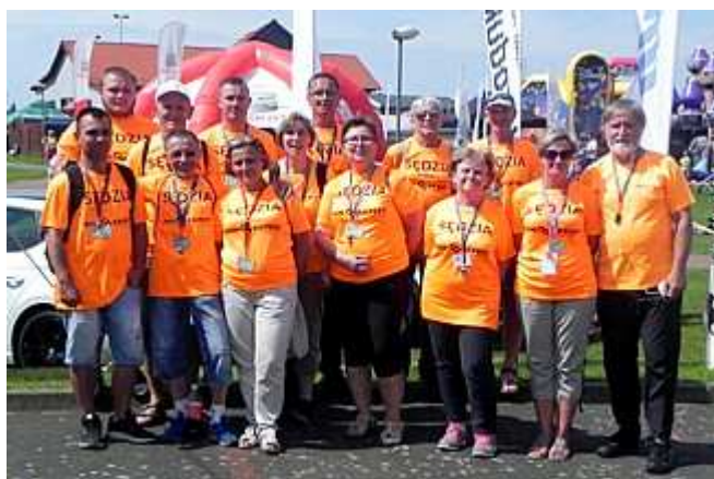
Sędziowie z Polickiego Kolegium Sędziów LA